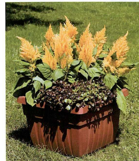
Celosia plumosa 'Fresh Look Gold'

Ibridata per essere naturalmente compatta e ben ramificata, la coltivazione di Graffiti® non richiede l'uso di brachizzanti. La forma compatta