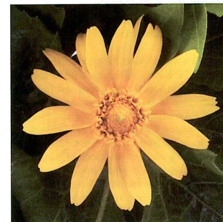
Melampodium paludosum 'Golden Globe'

consente di coltivarla utilizzando una minore spaziatura dei vasi, riducendo così i costi di produzione. Il portamento uniforme, la fioritura precoce e la coltivazione programmabile rendono Graffiti® una varietà facile anche da vendere. Caratterizzata da grandi fiori che si stagliano sul fogliame, ha un aspetto molto accattivante ed è molto resistente al caldo. Pianta annuale, trova impiego anche come pianta da vaso per in-