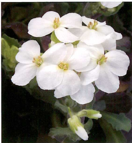
Arabis caucasica 'Snowfix'

zione. Disponibile come seme nudo, si utilizzano 1-3 semi per alveolo. Sono necessarie 8-12 settimane per il vaso verde, 5 mesi senza vernalizzazione e 8 mesi con vernalizzazione per il vaso fiorito.