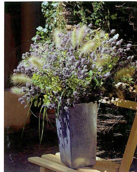
Eryngium planum 'Blue Glitter'

mane per il vaso verde e 6/7 mesi per il vaso fiorito, senza vernalizzazione.