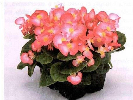
Begonia semperflorens F1 hybrid 'Sprint Blush' (sopra) e 'Scarlet' (sotto).