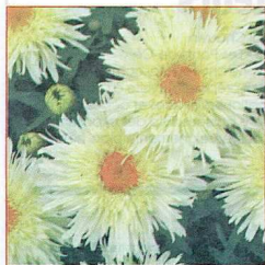
Chrysanthemum maximum 'Golddrausch'.