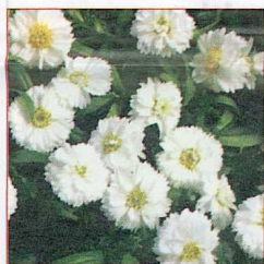
Achillea ptarmica GIPSY® White.

Cette achillée ressemble à du gypsophile. Plante tolérante à la chaleur; fleurit tout l'été. Utilisations: suspensions, jardinières, et pour la production de plantes estivales. Nouveauté dans la gamme de diversification GOLDFISCH™ (Goldsmith/Fischer).