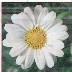
Argyranthemum frutescens MOLIMBA® mini white'.

Ce cultivar est sélectionné pour pot de 10 cm. Il ne nécessite ni pincement ni nanifiant. En 10 semaines, il donne une plante prête à vendre. Cultivar