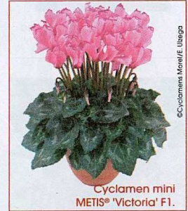
Cyclamen mini METIS® 'Victoria' F1.