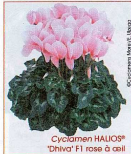
Cyclamen HALIOS® 'Dhiva' F1 rose à œil

Veuillez vous reporter au Guide des visiteurs encarté dans cette édition.