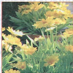
Coreopsis grandiflora ILLICO®.

médié d'or Fleuro-select 2006. SYNGENTA SEEDS, LES-PONTS-DE-CÉ (49)