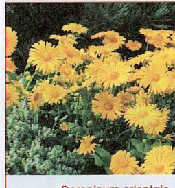
Doronicum orientale LEONARDO™.