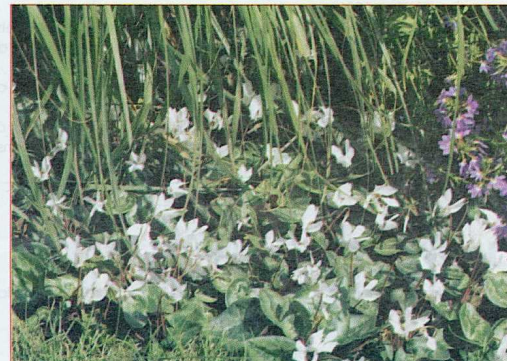
Cyclamen hederifolium AMAZEME™.

Présentation à la vente avec le feuillage décoratif tout l'hiver. Exposition: au jardin à l'ombre où,