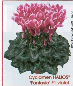
Cyclamen HALIOS® 'Fantasia' F1 violet.