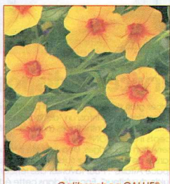
Calibrachoa CALLIE® 'Gold with Red Eye'.