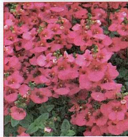
Diascia hybrida DARLA® rose.