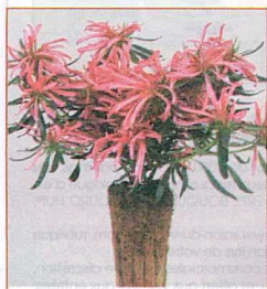
Azalea 'Kinku Saku'.