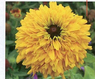
Unvergleichlich sind die Blüten von Sonnenhut 'Maya'.

sind im Garten und in der Vase einzigartig schön. Sie leuchten über dem dunkelgrünen Laub und erinnern an die glühende Sonne der Prairie. Rudbeckia 'Maya' mit gefüllten Blüten ist ebenso ein Gartenjuwel und eine Super-Topfpflanze (Goldmedaille 2005).