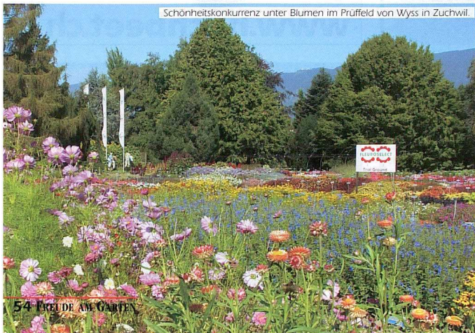
Schönheitskonkurrenz unter Blumen im Prüffeld von Wyss in Zuchwil.