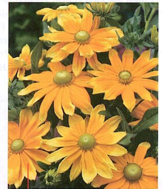
... and the winner is ... Sonnenhut 'Prairie Sun'.

'Noverna Purple' ist die erste Bartnelke in reiner Farbe, die ohne Überwinterung blüht.