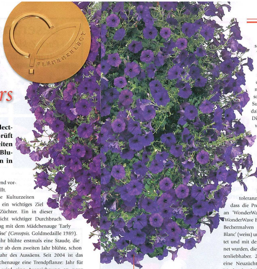
Goldmedaille für die vitale und wetterfeste Petunie 'WonderWave Blue'

folgend vorgestellt. Kurze Kulturzeiten sind ein wichtiges Ziel der Züchter. Ein in dieser Hinsicht wichtiger Durchbruch gelang mit dem Mädchenauge 'Early Sunrise' ( Coreopsis , Goldmedaille 1989). Mit ihr blühte erstmals eine Staude, die bisher ab dem zweiten Jahr blühte, schon im Jahr des Aussäens. Seit 2004 ist das Mädchenauge eine Trendpflanze: Jahr für Jahr wird eine Auszeichnung an neue Sorten für noch bessere Eigenschaften verliehen. Ein ebenso neues und erstaunliches Kulturkonzept gibt es für die Bartnelken ( Dianthus barbatus ). Mit der Sorte 'Noverna