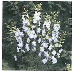
«Sydney Blue Picotee» – Une fleur coupée unique et excellente.

Cette combinaison de couleurs est un ajout très intéressant dans la gamme des Delphinium consolida . Il est vrai que l'assortiment comprend déjà de nombreux cultivars, en particulier en ce qui concerne la couleur, qui se rapproche de «Blue Picotee». Cependant, ils sont plus proches des types sauvages et donc manquent de l'uniformité si importante en fleur coupée. De plus, les couleurs de ces cultivars tendent à se délayer. Comme son nom l'indique, «Sydney Blue Picotee» fait par-