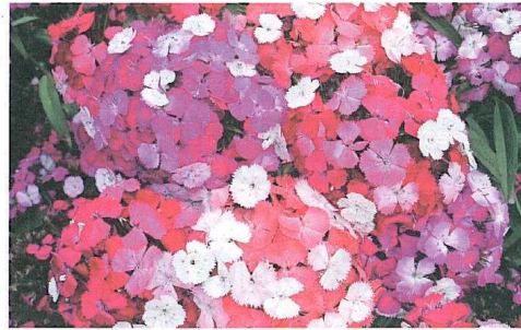
«Noverna Clown» – Des changements de couleurs comiques pour une garden party.

«Noverna Clown» a beaucoup à apporter au producteur, qui peut trouver des opportunités de vente à la fois en ventes précoces et en automne. Pas besoin de prudence avec ce 2007 Gold Medal. Le coloris joue avec les blanc et rose, saumon et violet. Il se remarque de suite sur les tablettes des jardineriers. C'est particulièrement vrai quand 3 plantes ou plus sont regroupées ensemble dans un pot ou une vasque. Dans ce cas, choisir au minimum un pot de 15 cm. Normalement, des pots de 9 ou 12 cm suffisent. L'utilisation de régulateur de croissance garantit que cet œillet de poète peut être proposé en tant que belle annuelle estivale compacte.