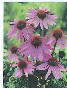
«Prairie Splendor» change le pourpre en or.

En prenant en compte que les jeunes plants sont parfois plantés