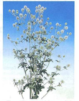
«Blue Glitter» – Une parfaite fleur coupée idéale au jardin.

Toutefois, la culture en conteneurs est plus facile à contrôler. Dans ce cas, il est préconisé de planter 3 - 5 plantes en conteneurs de 25 à 40 litres. Ceux-ci peuvent être stockés au froid à 1°C pendant un certain temps, après quoi les plantes pourront être forcées entre 12 à 18°C pour amener à floraison. De plus, après hibernation, les plantes poussent mieux et produisent des tiges de bien meilleure qualité.