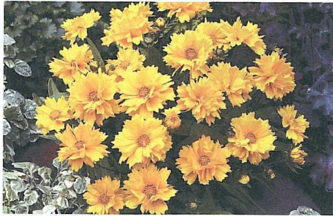
«Presto» – Un nouveau look pour les Coreopsis .

Couleur: jaune or. Fleur: double, 6 cm de diamètre. Floraison: de juin à août. Type: vivace, issu de pollinisation ouverte, diploïde. Utilisation: plante à massifs, balcons/terrasses/patios.