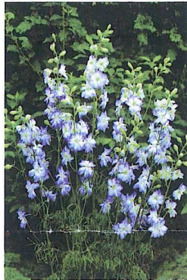
Delphinium consolida 'Sydney Blue Picotee'