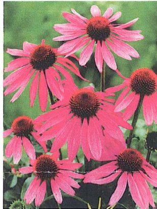
Echinacea purpurea 'Prairie Splendor'

(rp/ack) Die ausgezeichneten und über Samen vermehrbaren Pflanzen sollen an dieser Stelle in alphabetischer Reihenfolge kurz vorgestellt werden: