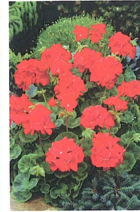
Pelargonium hortorum 'Infiniti Scarlet'