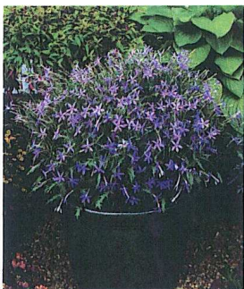
Laurentia hybrida F1 'Avant-garde Blue' und 'Avant-garde Pink'

ausserdem durch vertikale Verzweigung, Frühzeitigkeit und Gleichmässigkeit aus. Zusammen mit den anderen Farben dieser Serie ist 'Sydney Blue Picotee' ein perfekter Rittersporn für Anbau im Gewächshaus. Pflanzenhöhe 120 cm, Pflanzung 50 bis 64 Pflanzen pro Quadratmeter.