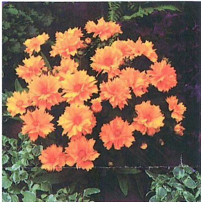
Coreopsis grandiflora 'Presto'

Für das Jahr 2007 erkoren die Mitglieder der Fleuroselect-Jury nicht weniger als neun verschiedene Sorten zu Goldmedaillengewinnern. Etliche unter ihnen sind Stauden.