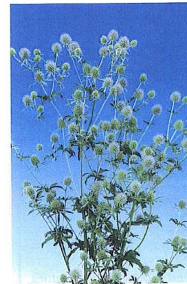
Eryngium planum 'Blue Glitter'