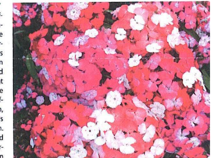
Dianthus barbatus F1 'Noverna Crown'

'Infiniti Scarlet' ist ungewöhnlich früh in Blüte, kombiniert mit grossen Blumen und ausgezeichneten Garteneigenschaften. Diese Qualitäten kommen bei samenvermehrten Pelargonien bisher selten gemeinsam vor. Darüber hinaus zeichnet sich Infiniti durch eine kurze Kulturdauer von etwa 95 Tagen aus. Die Pflanzen dieser Sorte blühen nicht nur früh, sondern auch länger. Anzucht bei 15 °C, Standardlicht,