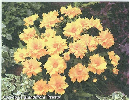
Coreopsis grandiflora 'Presto'

◀ mi żółtożółtymi kwiatostanami o średnicy 6 cm, niskim wzrostem i zwartym pokrojem — zarówno wysokość, jak i średnica roślin wynoszą 20 cm. Kwitnienie jest długotrwałe (od czerwca do sierpnia). Odmiana 'Presto' zalecana jest do uprawy w skrzynkach balkonowych, pojemnikach tarasowych, a także na rabatach, w tym na miejskich kwietnikach. Jej hodowcą jest przedsiębiorstwo Clause Tézier.