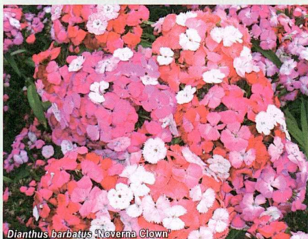
Dianthus barbatus 'Noverna Clown'

To kolejna wyróżniona złotym medalem Fleuroselectu odmiana z grupy Noverna ('N. Purple' została laureatką 2002 r.), której zaletą jest m.in. kwitnienie w pierwszym roku uprawy, czyli bez jaryzacji (goździk brodaty należy do grupy roślin dwulet-nich). 'Noverna Clown' ma ponadto atrakcyjne kwiatostany, zmieniające barwę w trakcie rozwoju — na początku wszystkie kwiaty w kwiatostanie są białe, a następnie stają się różowe, lososiowe albo fioletowe. Rośliny dorastają do wysokości 40 cm, nadają się zarówno do sadzenia na rabatach, jak i do uprawy w pojemnikach. Wskazane jest użycie retardantów wzrostu podczas produkcji goździków z grupy Noverna. Z czerwcowego wysiewu nasion uzyskuje się kwitnące okazy późnym latem, a z siewu jesienno — można otrzymać handlowy towar wczesną wiosną. W punktach sprzedaży najlepiej wyglądają pojemniki o średnicy 15 cm (lub większej) z co najmniej trzema roślinami. Opisywana odmiana, która jest heterozyjna, została wyhodowana w firmie Kieft Seeds Holland.