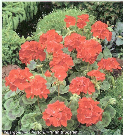
Pelargonium x hortorum 'Infiniti Scarlet'

● Pelargonium rabatowa ( Pelargonium x hortorum , syn. P. zonale ) 'Infiniti Scarlet'