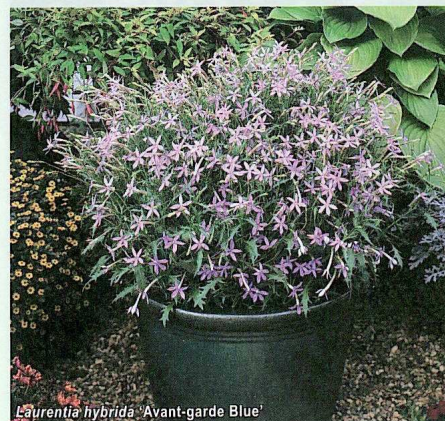
Laurentia hybrida 'Avant-garde Blue'

Ten gatunek to mniej znany przedstawiciel grupy roślin balkonowo-rabatowych. Zakłada się, że dzięki dwóm ww. odmianom, które różnią się barwą kwiatów (u pierwszej są niebieskie, u drugiej różowe), zyska większą popularność. Te mieszance heterozyjne wyróżniają się bowiem wczesnością, a zarazem długotrwałym i obfitym kwitnieniem, wigorem, intensywnym krzewieniem się roślin od samej podstawy, a co za tym idzie — ładnym pokrojem. Dorastają do wysokości 25–30 cm, natomiast szerokość wynosi 30–35 cm. Podkreśla się również ich odporność na wysoką temperaturę. Hodowcą grupy Avant-garde jest przedsiębiorstwo Thompson & Morgan.