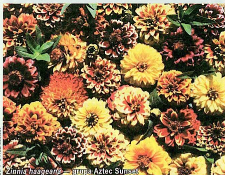
Zinnia haageana — grupa Aztec Sunset

Jest to grupa odmian (ustalonych) — oferowanych na razie tylko w postaci mieszanek — wyróżniających się pełnymi dwubarwnymi kwiatostanami o średnicy 5 cm, a także niskim wzrostem roślin i ich zwartym pokrojem. Cynie te dorastają zaledwie do wysokości 15 cm, szerokość ich nie przekracza 25 cm. Dobrze się rozkrzewiają, kwitną obficie od czerwca, lipca do przymrozków i są odporne na mączniaka prawdziwego. Są polecane na rabaty (w rozstawie 30 x 30 cm), a dzięki pokrojowi oraz oryginalnym kwiatostanom stanowią atrakcyjny produkt w punktach sprzedaży detalicznej, przyciągając uwagę kupujących. Grupę Aztec Sunset wyhodowano w brytyjskiej firmie Thompson & Morgan.