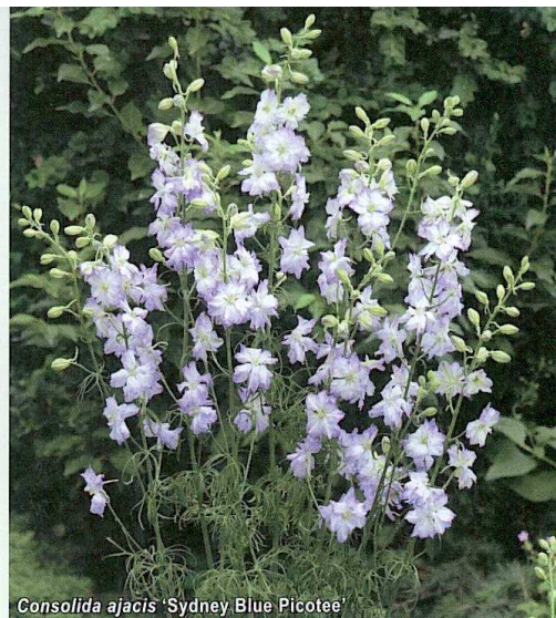
Consolida ajacis 'Sydney Blue Picotee'

● Ostróżeczka ogrodowa ( Consolida ajacis , syn. Delphinium consolida ) 'Sydney Blue Picotee' Czwarta z wyróżnionych najwyższą nagrodą Fleuroselect odmiana (ustalona) z grupy Sydney, tym razem o białych kwiatach z niebieską obwódką. Podobnie jak poprzedniczki,