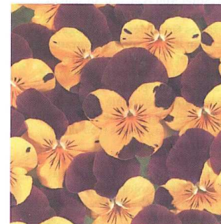
La pensée Floral Power , de Sahin (CH).

Voici un zinnia qui se distingue par son port exceptionnellement