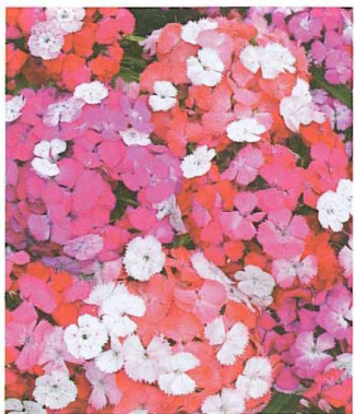
L'œillet des poètes Noverna Clown , de Kieft (NL).

épanouissement, elles changent en rose, saumon ou violet.