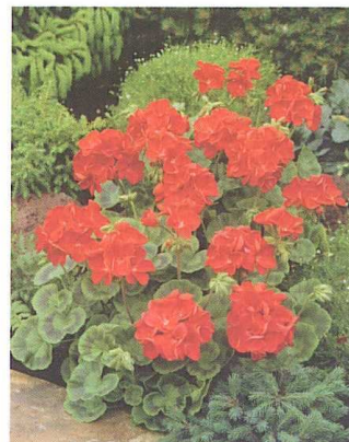
Le pélargonium Infiniti Scarlet , de Floranova (GB).

culture en packs, chez les professionnels.