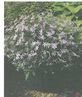
Le laurentia Avant-Garde Pink, de Thompson and Morgan (GB).

Un coloris vraiment très original pour l' œillet des poètes Noverna Clown . Quand les fleurs s'ouvrent, elles sont blanches. Mais au fur et à mesure de leur