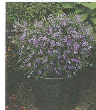
Le laurentia Avant-Garde Blue, de Thompson and Morgan (GB).

Comme leur nom l'indique, les variétés Avant-Garde font preuve d'une remarquable précocité,