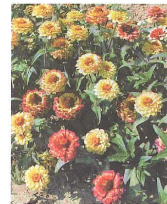
Le zinnia Aztec Sunset , de Thompson and Morgan (GB).

compact, ses grosses fleurs doubles (5 cm de diamètre) et ses coloris chatoyants.