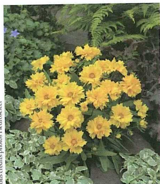
Le coreopsis Presto, de Clause-Tézier (FR).