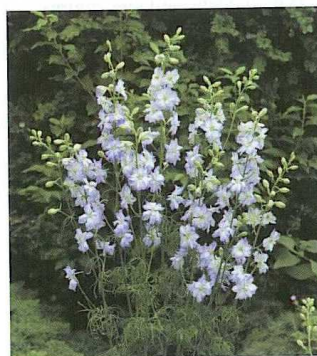
Le delphinium Sydney Blue Picotee, de Kieft (NL).