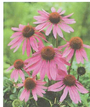
L'echinacea Prairie Splendor, de Syngenta (NL).

Encore un coréopsis primé par Fleuroselect. Comme les précédents lauréats, et comme son nom l'indique, Presto a l'avantage de fleurir la première année. Ce qui rend Presto unique, ce sont ses fleurs doubles, combinées à un port naturellement court. En fait, Presto fait partie des coréopsis semi-doubles, mais elle produit plus de fleurs doubles que toute autre, et elle continue à fleurir sur une période particulièrement longue. Les plantes forment des "boules" de 20 cm de diamètre et 15 cm