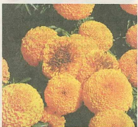
Hat diese großblumige goldgelbe Tagetes gute Chancen für Fleuroselect-Gold? Nächstes Jahr wissen wir's.

Die feierliche Verleihung der Goldmedaillen erfolgte am 1. August auf dem Festabend anlässlich des Fleuroselect-Kongresses in Santa Barbara. [eh]