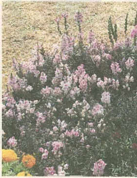
Ein Garten-Löwenmäulchen mit fast schwarzen Blättern stieg bei Besichtigung der amerikanischen Fleuroselect-Felder zu einem der Favoriten auf.

Da der Fleuroselect-Kongress 2006 in Kalifornien stattfand, werden die zum Fleuroselect-Neuheitentest eingesendeten Sorten dieses Jahr außer an 30 europäischen Standorten auch in drei kalifornischen Betrieben getestet. Nachfolgend einige Eindrücke von den Testflächen bei Bodger in Lompoc und PanAmerican Seed in Santa Paula. Die Fleuroselect-Mitglieder besuchten diese beiden US-amerikanischen Betriebe am 31. Juli und 1. August.