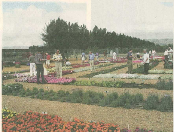
Eingehüllt von Bergen und dem großen Citrus-Gürtel im südlichen Kalifornien liegt Santa Paula. Hier – nahe der Millionenstadt Los Angeles – liegt der kalifornische Zweigbetrieb von Pan American Seed. Dort wurde dieses Jahr auch ein Fleuroselect-Testfeld angelegt. Beim Kongress fand es viel Interesse der Saatgutfirmen.