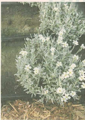
Cerastium tomentosum var. columnnea konnte in Santa Paula ebenfalls überzeugen. Englische Bezeichnung dieser Art: Snow-in-Sommer (Schnee im Sommer).

Vergleichssorte 'Silver Carpet' noch ohne Blüten war. Ausgesät wurde in Kalenderwoche 12, gepflanzt in Woche 18 (Startnummer: 10/06).