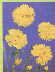
'Sunray', par Clause Tézier. Médaille 1980. Fleurs doubles jaune d'or. H: environ 50 cm.

Petit retour en arrière sur les Coreopsis grandiflora lauréats (médaillés d'or) depuis l'origine du concours Fleuroselect.