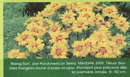
'Rising Sun', par PanAmerican Seed. Médaille 2005. Fleurs doubles frangées jaune à base acajou. Floraison plus précoce dès la première année. H: 50 cm.