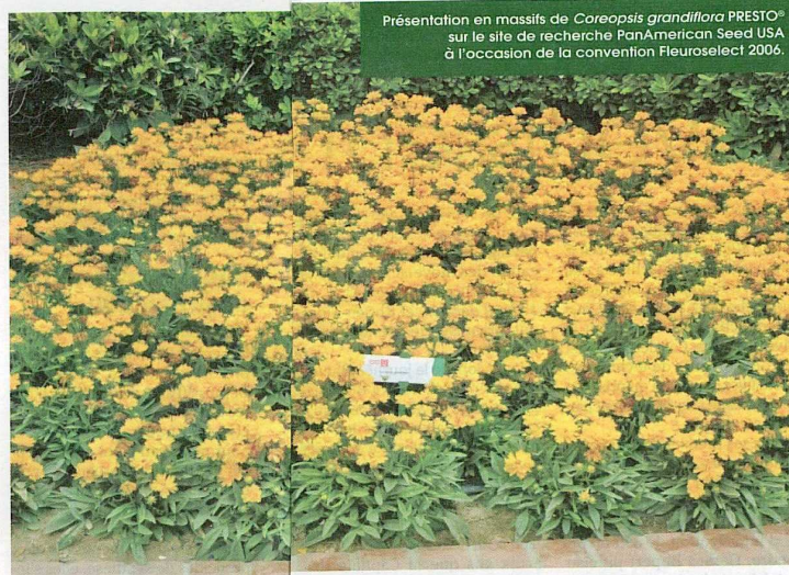
Présentation en massifs de Coreopsis grandiflora PRESTO® sur le site de recherche PanAmerican Seed USA à l'occasion de la convention Fleuroselect 2006.

Fiche de culture... Semis: 500 à 600 semences/gramme, de janvier à avril, pour une production en cycle annuel.