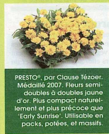
PRESTO®, par Clause Tézier. Médaille 2007. Fleurs semi-doubles à doubles jaune d'or. Plus compact naturellement et plus précoce que 'Early Sunrise'. Utilisable en packs, potées, et massifs.