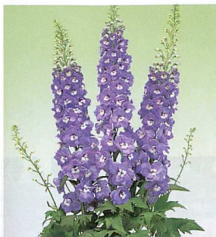
DELPHINIUM ELATUM F, AURORA 'LIGHT PURPLE'

du groupe Limagrain, nous vient un nouveau coreopsis fleurissant dès la première année à partir de la graine, soit 100 jours après le semis. L'abondance de fleurs jaune or, semi-doubles à doubles, et la profusion avec laquelle elles sont produites sont sa marque de commerce. Mesurant 6 cm de diamètre, elles s'épanouissent de juin à août. De plus, 'Presto' n'a besoin d'aucun régulateur de croissance pour devenir une petite boule aplatie très compacte de 20 cm de large par 15 cm de haut.