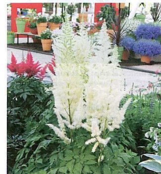
ASTILBE CHINENSIS 'DIAMONDS AND PEARLS'

De l'hybrideur hollandais Harrie Verduin, Darwin Plants lance la première astilbe chinensis à fleurs blanches. Elle possède la robustesse associée à cette espèce et produit de très nombreux épis floraux à tiges épaisses et lourdement chargés de fleurs. Son feuillage vert très foncé offre un contraste saisissant.