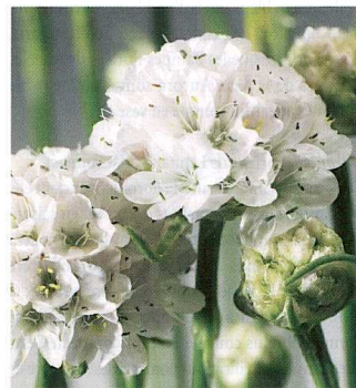
ARMERIA MARITIMA ARMADA™ 'WHITE'

les consommateurs avec ses petites fleurs blanc lumineux qui brillent sous le soleil du printemps. Son port uniforme et compact ainsi que sa bonne performance au jardin devraient contribuer à son succès.