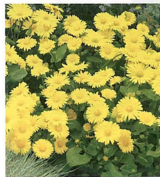
DORONICUM ORIENTALE LEONARDO™ 'COMPACT'

Peu de gens s'intéressent à la doronic, pourtant elle produit de jolies marguerites jaunes tôt en saison, bien avant les rudbeckies et C ic . Ceux qui n'aimaient pas les tiges plus longues de son grand frère Leonardo™ se réjouiront d'apprendre que S & G Flowers a réussi à développer une copie de ce dernier, en plus court et en plus compact. Cette sélection aux ramifications nombreuses se couvre de fleurs pendant plusieurs semaines et est recommandée pour la vente comme potée fleurie de printemps en pot de un litre. On lui a décerné un Fleuroselect Quality Mark en 2007.