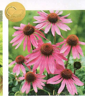
ECHINACEA PURPUREA PRAIRIE SPLENDOR™

S & G Flowers présente le premier Echinacea vivace qui fleurit à 100 % de sa capacité dès la première année, et ce, à partir de la fin juin. Nettement plus compact que ses congénères avec une taille de 60 cm seulement, ce cultivar porte des fleurs simples, rouge rosé, mesurant 10 à 15 cm de diamètre. Elles apparaissent très tôt en saison et habillent le plant jusqu'aux premières gelées. Il est recommandé aux producteurs de prévoir entre trois à cinq plants de 'Prairie Splendor' par pot de trois litres pour obtenir