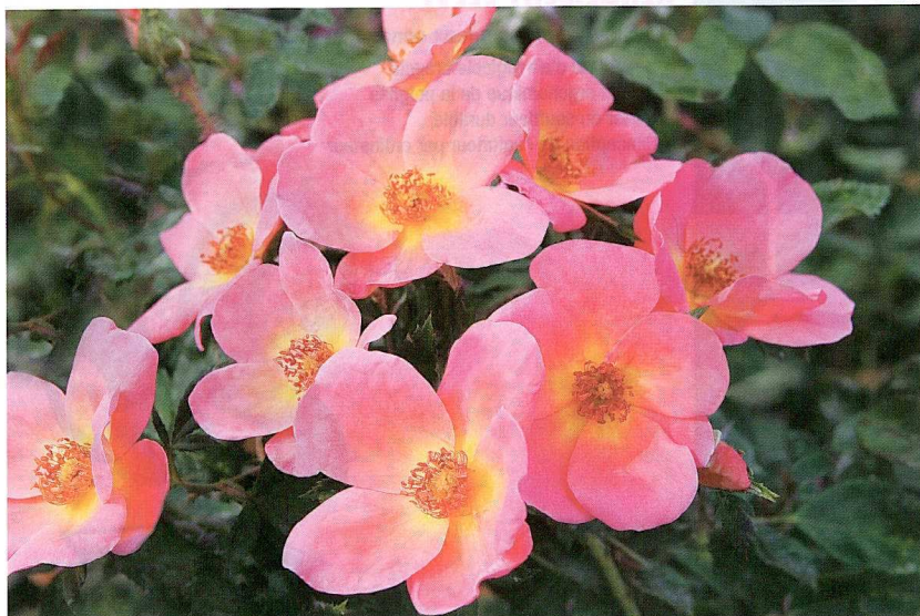
ROSA RAINBOW KNOCK OUT®

Une fois de plus, le temps est venu de miser sur les plantes vivaces, les arbres et les arbustes qui obtiendront le plus grand succès dans les jardins de la province!