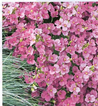
ARABIS CAUCASICA LITTLE TREASURE™ 'DEEP ROSE'

On ne s'étonne pas d'apprendre que cette arabette est rapide et facile à produire puisqu'elle est une semence FastraX de Benary. Elle promet de séduire