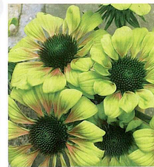
ECHINACEA PURPUREA 'GREEN ENVY'

D'instinct, on associe le vert aux feuillages et non aux fleurs, ce qui est faux dans le cas de 'Green Envy', une sélection offerte par Vanhof & Blokker Ltd. et Pride of Place Plants Inc. La fleur revêt une couleur vert jade non dénuée d'intérêt, ne fut-ce que par la surprise qu'elle cause. Aussi, ses larges pétales arrondis, qui se teintent de rose magenta à maturité, lui donne une forme pleine fort agréable. La floraison s'étend de juillet jusqu'en automne et le plant vigoureux peut atteindre 75 à 90 cm de hauteur.