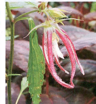
CAMPANULA PUNCTATA 'PINK OCTOPUS'

Une sélection à fleurs blanches vient tenir compagnie au cultivar Bellefleur™ 'Blue'. À l'instar de ce dernier, elle possède des tiges florales courtes