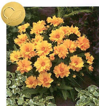
COREOPSIS GRANDIFLORA 'PRESTO'

du groupe Limagrain, nous vient un nouveau coreopsis fleurissant dès la première année à partir de la graine, soit 100 jours après le semis. L'abondance de fleurs jaune or, semi-doubles à doubles, et la profusion avec laquelle elles sont produites sont sa marque de commerce. Mesurant 6 cm de diamètre, elles s'épanouissent de juin à août. De plus, 'Presto' n'a besoin d'aucun régulateur de croissance pour devenir une petite boule aplatie très compacte de 20 cm de large par 15 cm de haut.