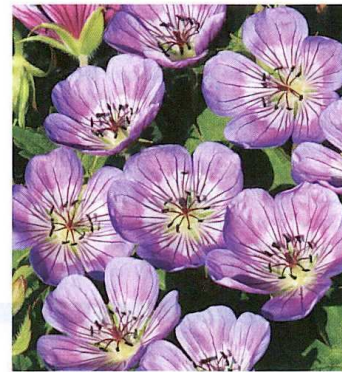
GERANIUM 'SWEET HEIDY'