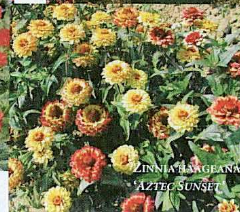
ZINNIA HAAGEANA 'AZTEC SUNSET'