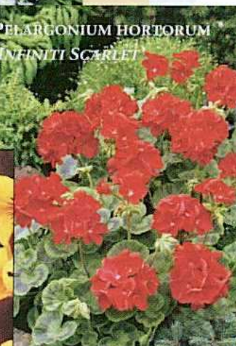
PELARGONIUM HORTORUM 'INFINITI SCARLET'