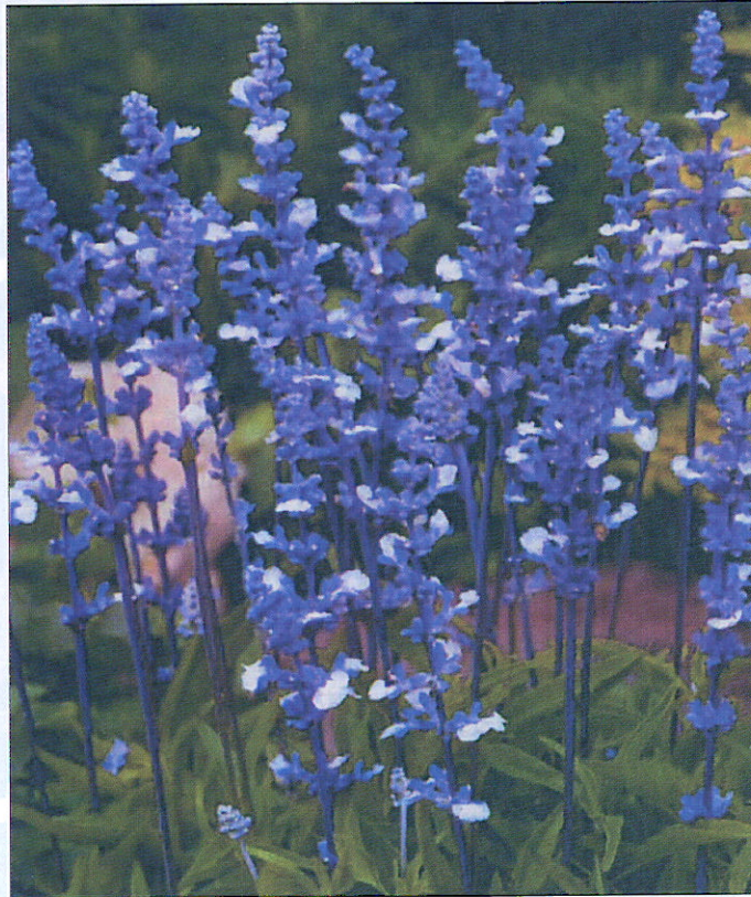
Salvia farinacea 'Fairy Queen'

Con questa varietà si apriranno grandi opportunità per i giardinieri. Con il suo portamento a cespuglio compatto e dagli steli sottili 'Fairy Queen' apporta in giardino una presenza mistica, aerea a tutte le macchie di colore, alle bordure, alle distese erbose, ai giardini