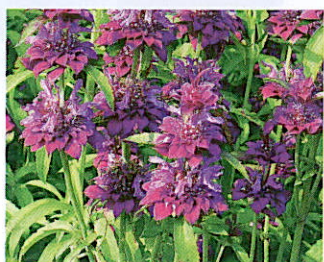
Monarda x hybrida 'Bergamo'