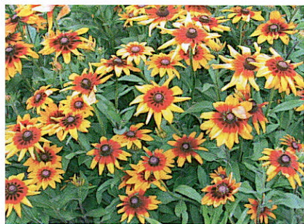
Rudbeckia hirta 'Cappuccino'