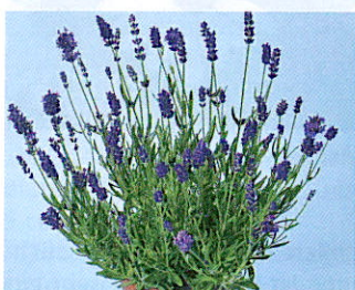
Lavandula angustifolia 'Ellagance Purple'