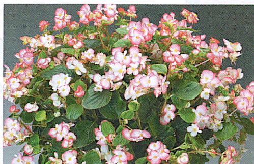
Begonia semperflorens 'Volumia Rose bicolor'