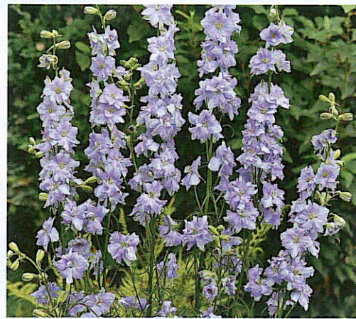
Delphinium consolida 'Sydney Light Blue'