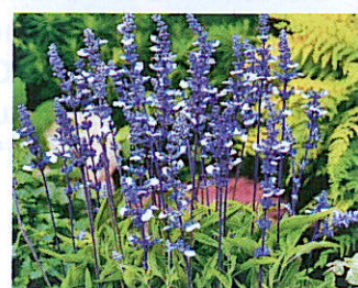
Salvia farinacea 'Fairy Queen'