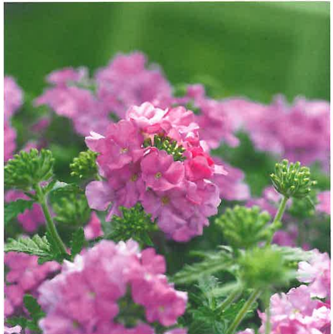
Verbena 'Compact Lascar® Pink', Selecta Klemm, har ovanligt stora blommor, kompakt tillväxt och kontinuerlig blomning.

I fjol var vinnaren av Fleuroselect Industry Award 2009 Di-anthus barbatus 'Diabunda Purple Picotee' från Syngenta Flowers. Det är en dagsneutral sort som kan odlas till försäljning på våren, sommaren eller hösten.