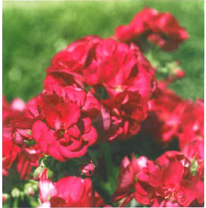
Zonale-pelargonen 'Sunrise® XL Evita' från Selecta Klemm har strålande färg, utmärkt förgrening och medelkraftig till kraftig tillväxt.