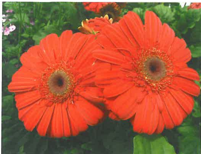
Gerberan 'Grandèra® Bright Red' från Kieft-Pro-Seeds har kompakt form och intensiv blommfärg. Den är också snabbodlad.