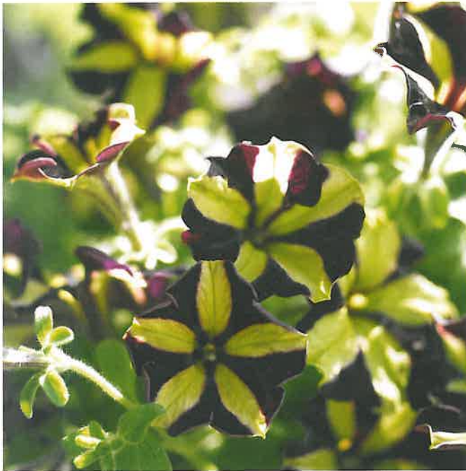
Petunia x hybrida 'Phantom', Ball FloraPlant har sammetsaktiga kronblad med nästan svart botten som kontrasterar med en gul stjärna i mitten.