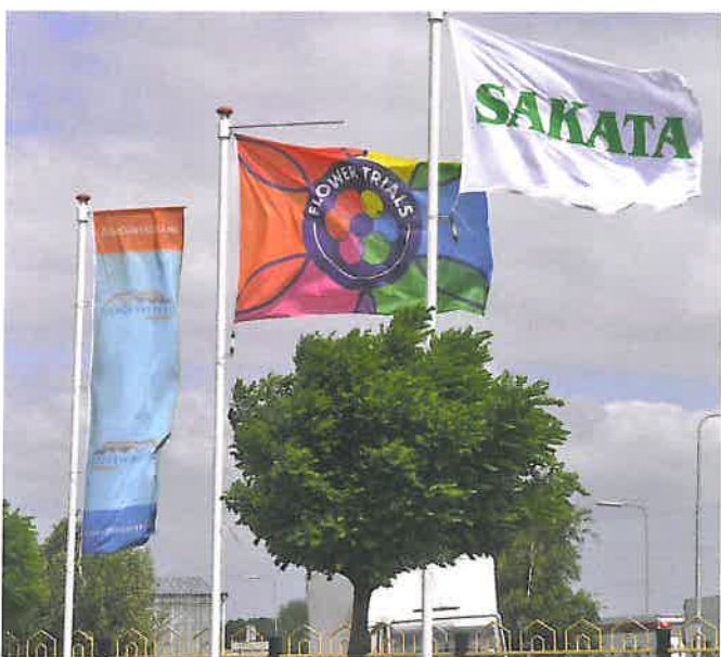
De nominerade sorterna presenterades vecka 24 vid FlowerTrials® på fem odlingar.