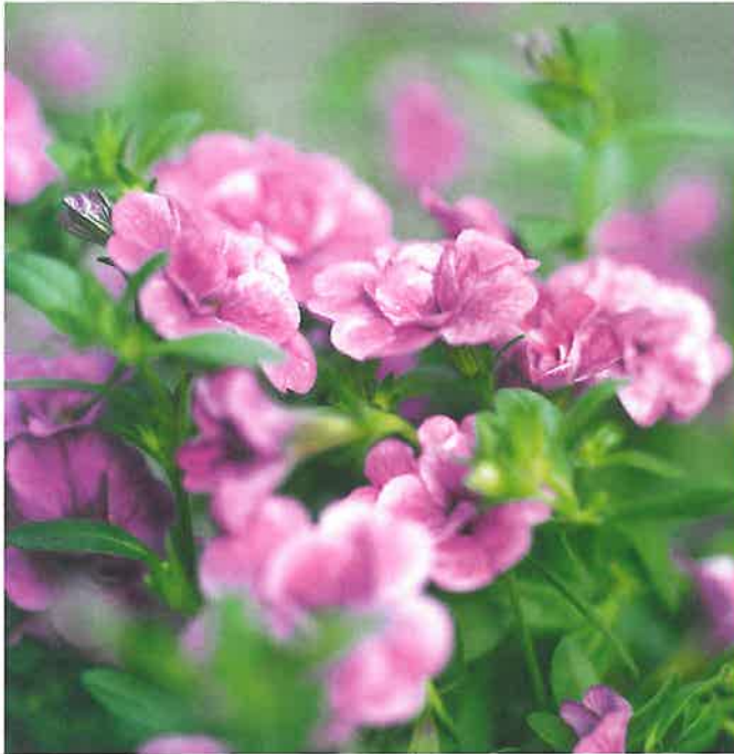
Calibrachoa 'MiniFamous® Double Pink', Selecta Klemm har god förgrening, lång blomningstid och blommor som hålls öppna även vid regn, skugga och på natten.