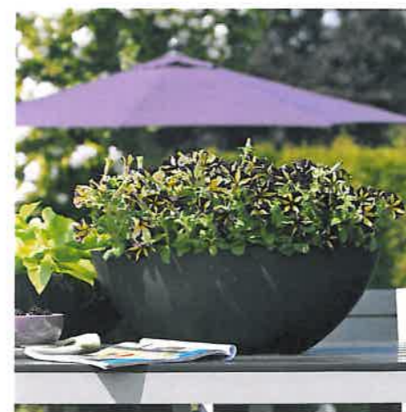
In eine Tischschale gepflanzt, ist die eigenwillige und überaus dekorative Blüte von 'Mystical Phantom' nicht zu übersehen. Eine ganz besondere Zierde für Sommer-sitzplätze im Freien.

Es verwundert schon, dass es immer noch grundlegende Überraschungen bei Pflanzenneuheiten gibt. Ist nicht schon längst alles erfunden, gezüchtet oder per Genmanipulation erschaffen? Da mutet es schon fantastisch an, dass im vergangenen Jahr eine Petunien-Neuzüchtung das Licht der Gärtnere Welt erblickte, die die Fachleute in Staunen und tiefe Bewunderung für die erbrachte Leistung versetzte. 'Mystical Phantom' heißt die Tiger-Petunie, von der eine große Faszination ausgeht. Trotz eines beträchtlichen und nahezu keine Wünsche mehr offen lassenden Sortenspektrums bei Petunien mit allen Farben, Formen und Größen, unterscheidet sich diese Rarität in ihrer Farbkombination von allem bisher Dagewesenen. Schwarz ist sie oder besser gesagt tief, tief Dunkelviolett. Und vor diesem Blütenfarbenhintergrund prangt ein heller Stern in Cremeweiß oder hellem Gelb. Ihr Wuchs ist aufrecht bis leicht hängend, kraftstrotzend und dicht verzweigt. Es lassen sich mit dieser Pflanze also schnell Balkonkästen, Ampelgefäße oder Kübel füllen. Immer erobert sich 'Mystical Phantom' unmittelbar das Terrain