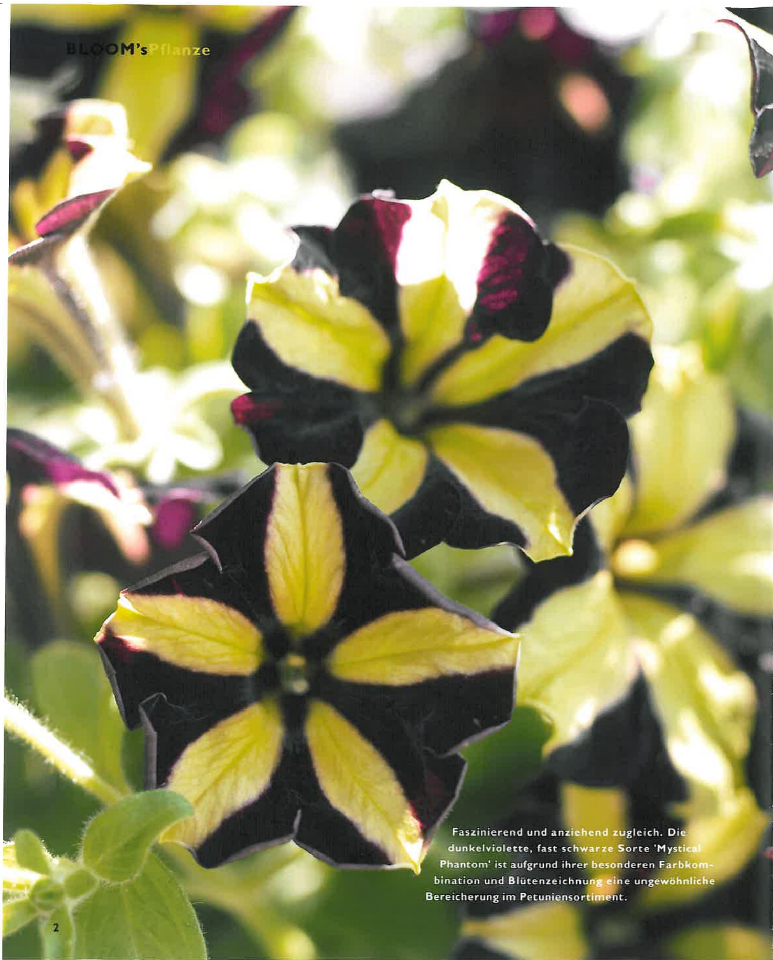
Faszinierend und anziehend zugleich. Die dunkelviolette, fast schwarze Sorte 'Mystical Phantom' ist aufgrund ihrer besonderen Farbkombination und Blütenzeichnung eine ungewöhnliche Bereicherung im Petuniensortiment.