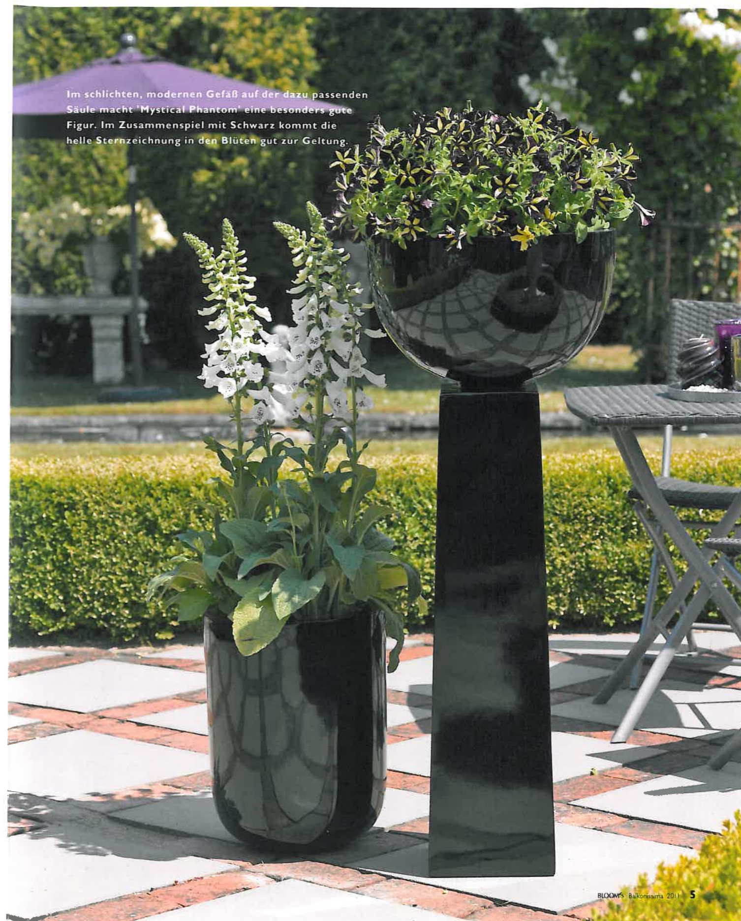
Im schlichten, modernen Gefäß auf der dazu passenden Säule macht 'Mystical Phantom' eine besonders gute Figur. Im Zusammenspiel mit Schwarz kommt die helle Sternzeichnung in den Blüten gut zur Geltung.