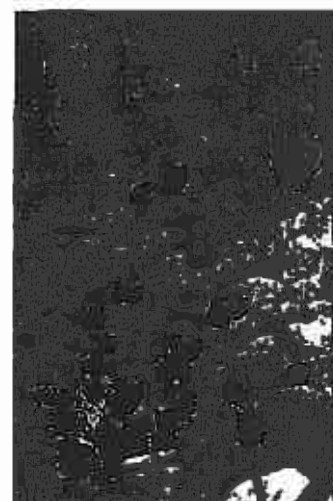
Salvia coccinea 'Summer Jewel Red' Jury: Compact groeiende Salvia met vroege bloei en korte teelt.