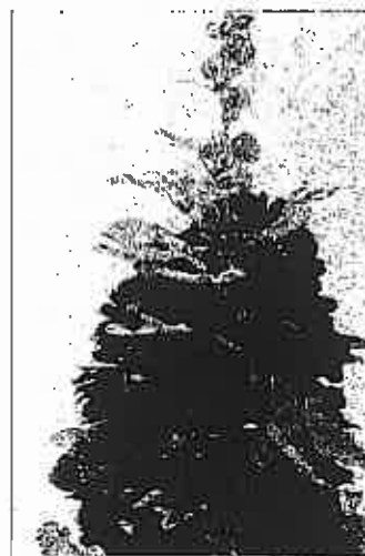
Alcea rosea 'Spring Celebrities' Jury: Unieke dwergplant met sterke stelen en grote bloemen.