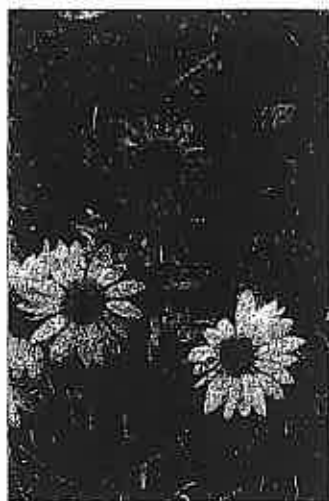
Echinacea 'Cheyenne Spirit' Jury: Een uniforme, eerstejaars-bloeiende stork Echinacea met goede planteigenschappen.