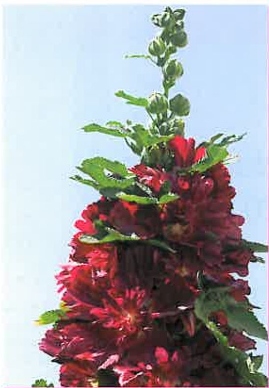
Alcea rosea annua 'Spring Celebrities Crimson'