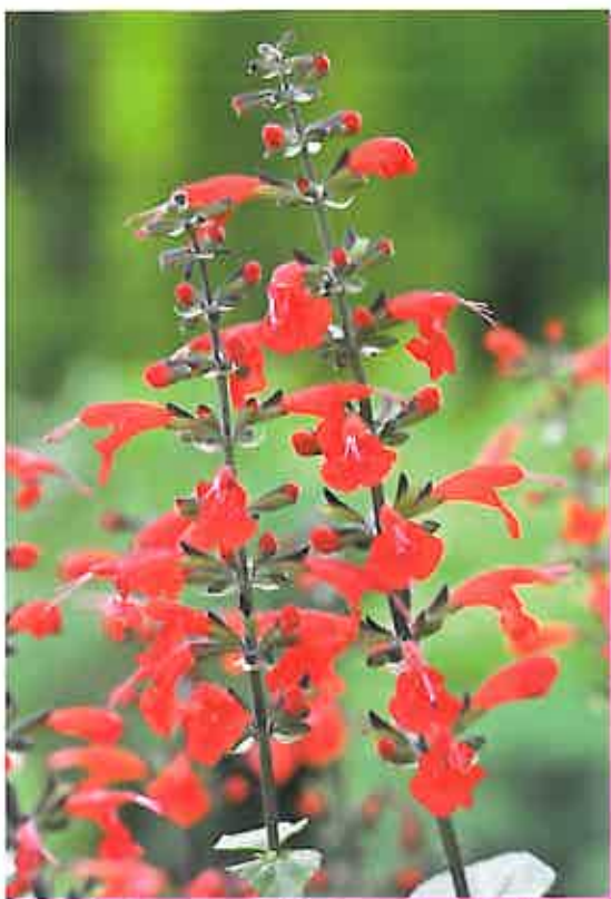
Salvia coccinea 'Summer Jewel Red'