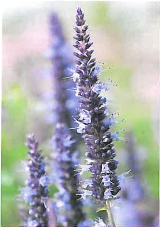
Agastache hybrida ‘Astello Indigo’

Al genere Agastache , originario dell’Asia dell’Est e del Nord America e conosciuto anche come Issopo o menta del colibrì, appartengono delle specie erbacee perenni della famiglia delle Lamiaceae .