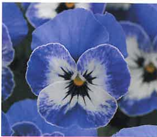
Viola cornuta 'Sorbet XP Delft Blue'

I peduncoli florali corti e il portamento della pianta perfettamente tondo consentono al coltivatore una produzione più ecologica ed economica, riducendo l'impiego dei brachizzanti,