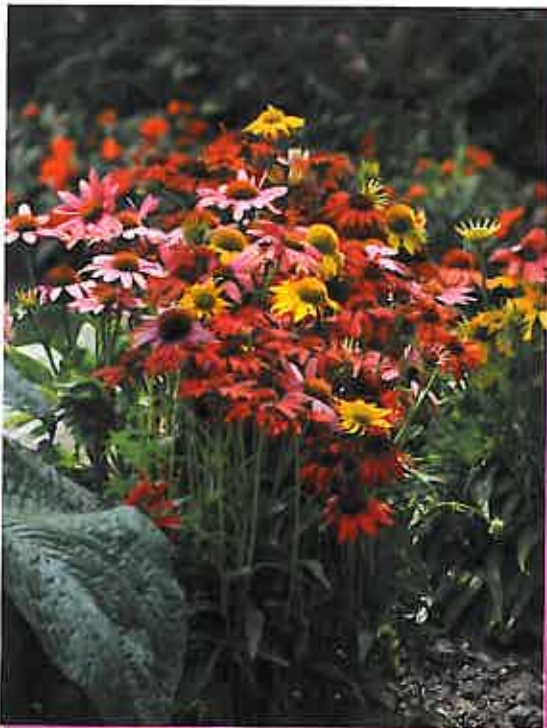
Echinacea hybrida 'Cheyenne Spirit'

Mentre la maggior parte delle varietà di Echinacea vengono propagate dalla coltivazione di